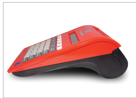
Forma compatta, linee curate e moderne