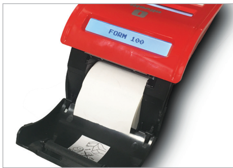
Inserimento rapido e agevole del rotolo carta