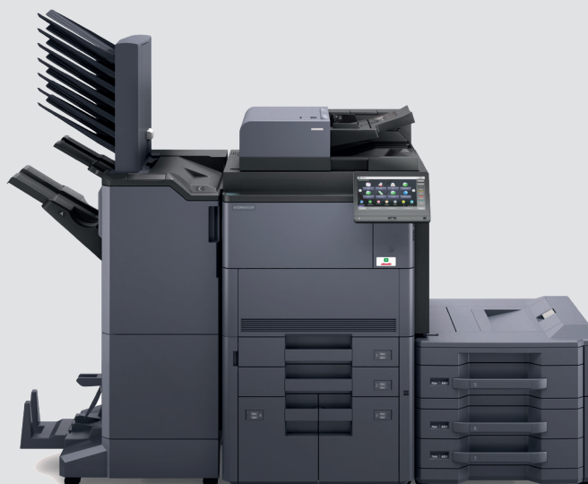
Configurazione con PF-730+PF-7130+DF-7110+MT-730+BF-730