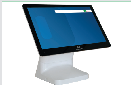
Display capacitivo per l'operatore