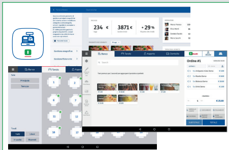
Applicazione di vendita MyShopApp