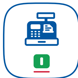
L'icona del launcher