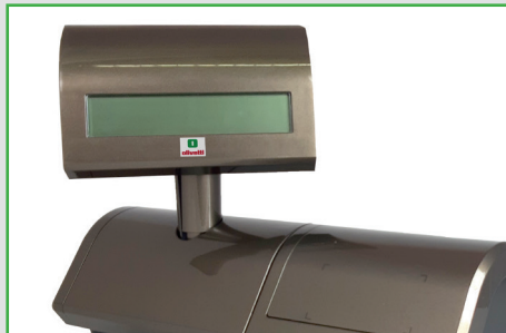
Display cliente sollevabile e ruotabile