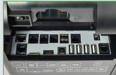
Ampia scelta di connessioni